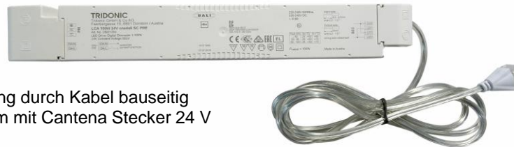
Konverter DALI 3206-5 3210-5 Eingang - Belegung durch Kabel bauseitig Ausgang 1.500mm mit Cantena Stecker 24 V 230V 50-60Hz prim./ 24 V DC sek.