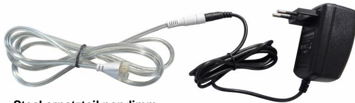
Steckernetzteil nondimm 3202-0 Ausgang 3.000mm mit Cantena Stecker 24 V